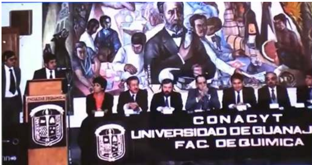
Ceremonia de inauguración de las plantas piloto para la producción de clorosilanos ante autoridades del Conacyt, del gobierno del estado de Guanajuato y de la Universidad de Guanajuato