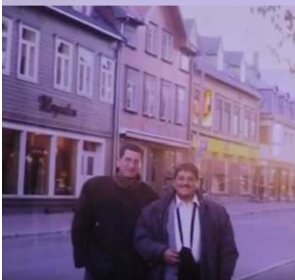
Foy en Tromsø, Noruega. Fotografía tomada a las 2 a.m. en temporada del sol de medianoche