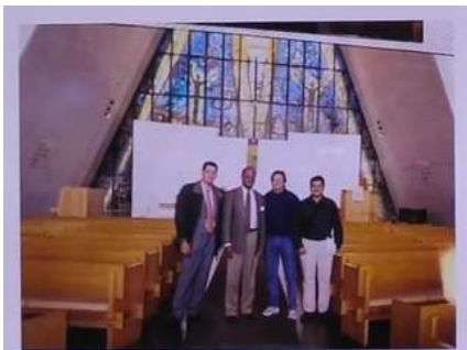
Visita a la llamada "Catedral del Ártico" en Tromsø, Noruega durante el evento "Silicio para la Industria Química y Solar"

Unos minutos más tarde, el sol despuntó y la breve noche concluyó y la estrella polar desapareció del firmamento.