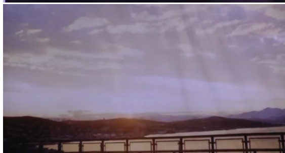
Tomas fotográficas del "Sol de Medianoche". Tromsø, Noruega