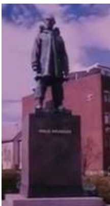
Escultura erigida en Tromsø, Noruega, en honor a Roald Amundsen, explorador noruego de las regiones polares. Conquistador del polo sur