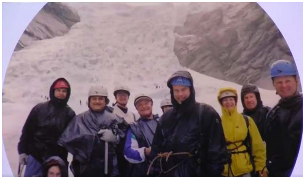
Excursión al glaciar de Brikdalsbreen, en Stryn, Noruega

Las relaciones con la comunidad internacional nos permitieron organizar en Guanajuato, con el apoyo de muchos colegas, estudiantes y diversas instituciones e industrias, el XIII Simposio Internacional de la Química Orgánica del Silicio en agosto de 2002, evento trianual reconocido como el de mayor relevancia en este tema a nivel internacional y que reunió a investigadores de 35 países relacionados con el silicio. Por cierto que, en la ceremonia de clausura, se nos ocurrió iniciar lo que ahora es una