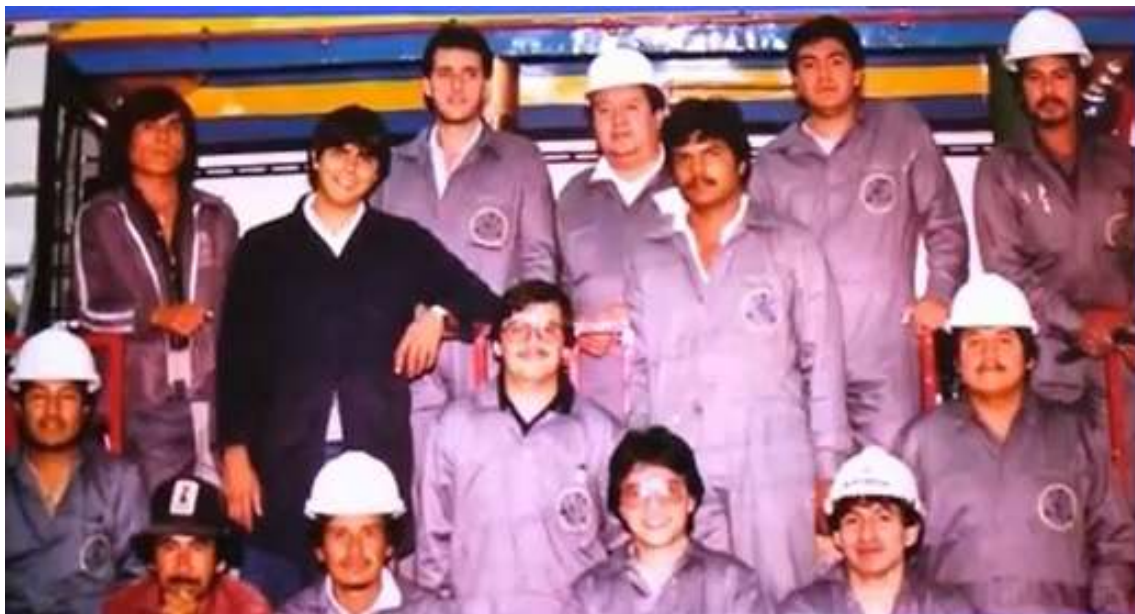
Integrantes del proyecto Conacyt dirigido a la construcción de plantas piloto para la producción de clorosilanos

Con el grupo, participó siempre con gusto, entusiasmo, lealtad y dedicación hasta su muerte, participando tanto en desarrollos experimentales a nivel de laboratorio, como a nivel planta piloto y, a la vez, aplicar modelos matemáticos en la parte tecnológica y así plantear y resolver problemas complejos empleando herramientas matemáticas y sistemas computacionales para modelar sistemas complejos de reacciones químicas.