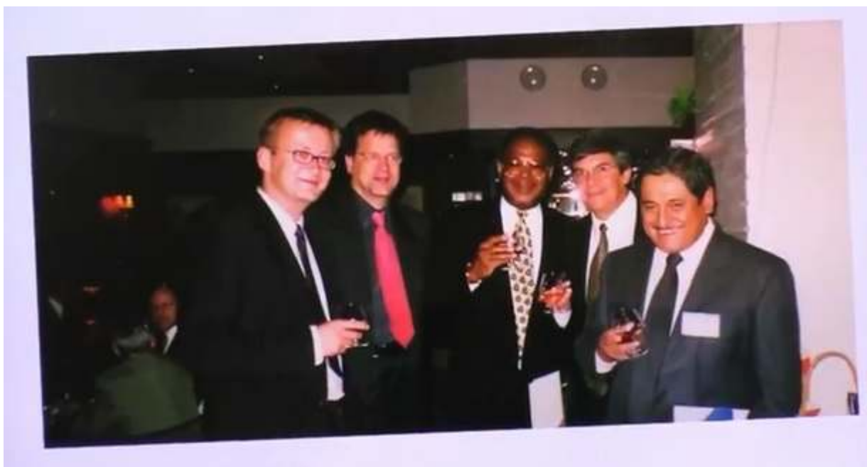
Participantes en la conferencia bianual "Silicio para la industria Química y Solar". Geiranger, Noruega